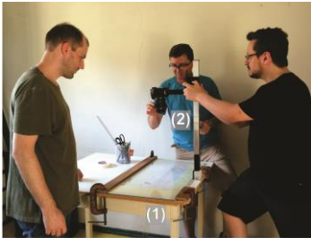
Figura 3: processo de aquisição de imagens de salvaguarda. (1) mesa com vidro antireflexo; (2) suporte para máquina fotográfica; (3) disparador da máquina fotográfica; (4) magnetograma; (5) escala graduada (cm) bidimensional.

A aquisição destas imagens (Fig. 3) foi realizada pela utilização de um aparato envolvendo uma mesa com vidro antireflexo (abaixo do qual os magnetogramas eram posicionados), acoplada a um suporte para máquina fotográfica, acionada por um disparador. À cada tomada de imagem de magnetograma, uma escala graduada (cm) bidimensional foi associada, de maneira a permitir correções de distorção em processos de aquisição de dados geomagnéticos, que eventualmente fossem baseados em tal processo. As imagens obtidas foram armazenadas em arquivos backup , possibilitando então a liberação dos documentos correspondentes para o traslado ao campus de São Cristóvão.