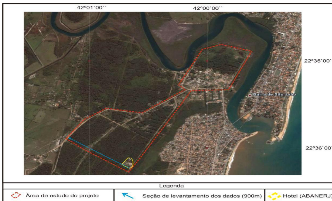
Figura 1 – Localização da área estudada