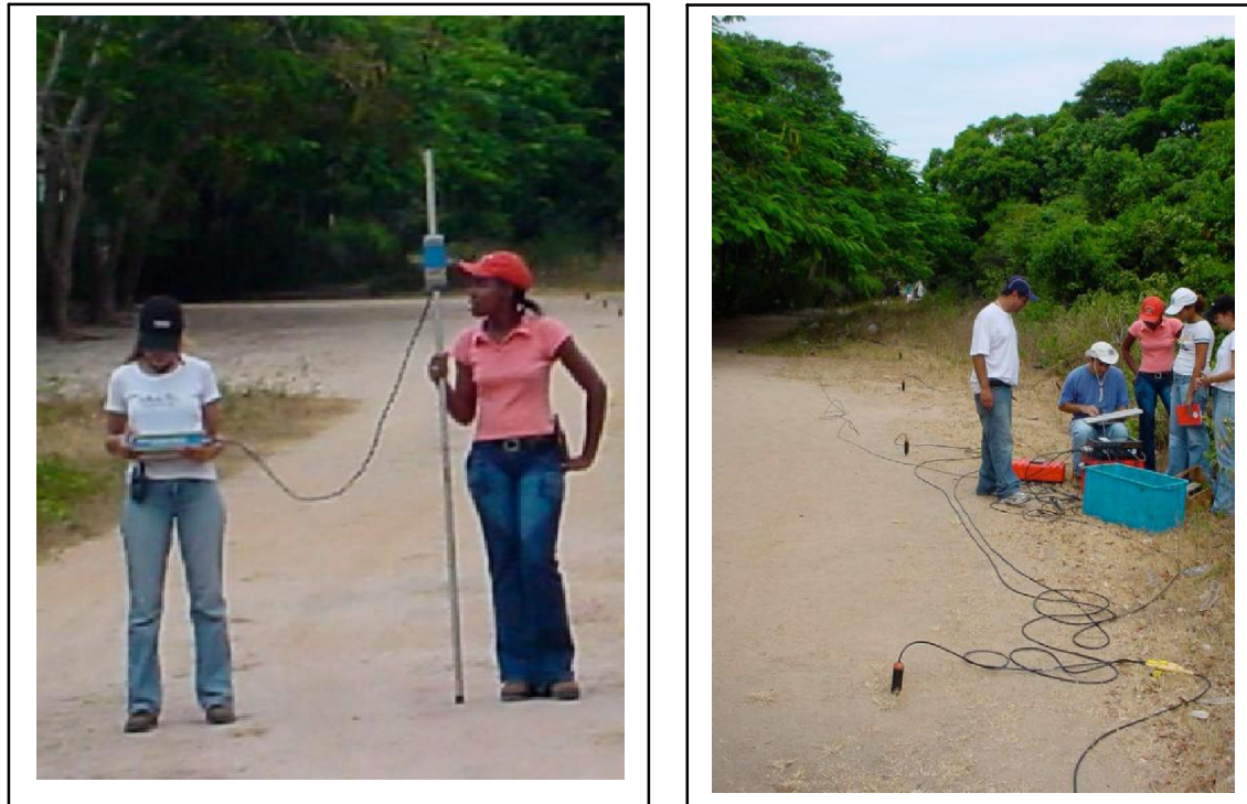
Figura 2 – Equipamentos utilizados para aquisição de dados: Magnéticos (painel esquerdo) e sísmica de refração (painel direito).