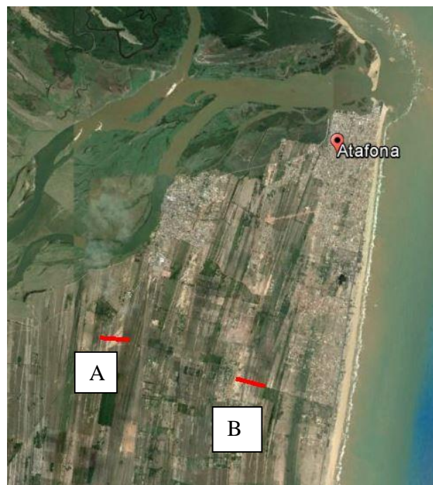
Figura 2 – Área dos levantamentos GPR linha A e B