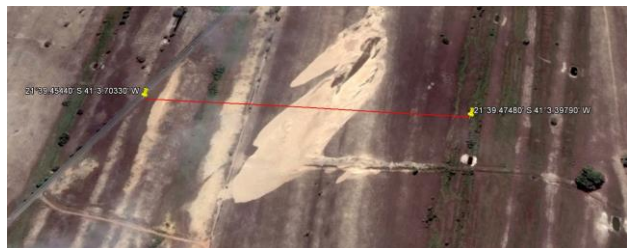
Figura 1 – Detalhe da duna em cristas de praia localizada na seção A da figura 2.

A área de estudo está localizada no município de Atafona que faz parte do complexo deltaico do Rio Paraíba do Sul no litoral Norte do Estado do Rio de Janeiro. A aquisição das linhas GPR foi realizada numa planície Quaternária Holocênica no Delta Sul e que tem como característica uma extensa área de feixes arenosos alongados formados pelo acumulo de sedimentos arenosos quaternários marinhos.