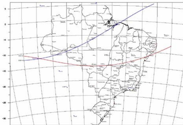
Figura 1: Variação do Equador Magnético entre 1912 e 2012 sobre o território brasileiro.

A região norte do Brasil é cortada pelo equador magnético, cuja característica principal é apresentar inclinação magnética nula ( dip=0 ). A dinâmica deste fenômeno, especialmente sobre o território brasileiro é bastante diferenciada. Pode-se observar na figura 1 que dentro de regiões com mesma longitude o equador magnético variou de maneira diferenciada no período de 1912 e 2012.